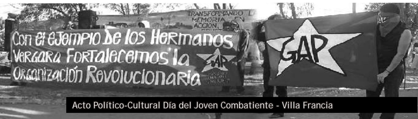
Acto Político-Cultural Día del Joven Combatiente - Villa Francia

No podemos obviar que la resistencia al modelo es todavía reducida, pero no porque no se pelee... por el contrario, recorriendo las experiencias de lucha del pueblo, encontramos que se multiplican los sindicatos