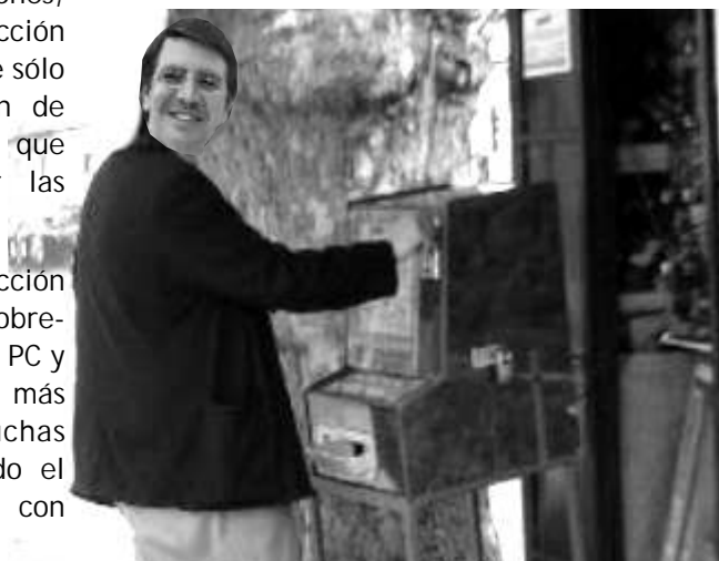
Novedosa estrategia electoral de Lavín

Sin sobrevalorar nuestras capacidades, sí estamos convencidos que en los territorios donde trabajamos, podemos jalonar a estos sectores de la izquierda a una práctica mucho más cotidiana y constructora. Debemos ser realistas: nuestra capacidad de intervención aún no nos permite generar una conducción revolucionaria que pueda incidir y disputar a nivel nacional con los sectores electoralistas que mantienen grados importantes de hegemonía en la sensibilidad y disposición popular, pero no es menor el número de poblaciones, liceos, universidades y centros de trabajo donde nuestra voz se hace escuchar. Es en este espacio de fortaleza donde debemos dar un impulso mayor a esta sensibilidad de izquierda que intenta recuperar y canalizar el Podemos, debemos transformar esta subjetividad de corto aliento electoral en un sentido permanente de oposición a los poderosos, en organización "clasista" (tanto social como política), que ponga en cuestión al capitalismo mismo y su explotación, y no sólo a los gobernantes y sus mecanismos de dominación.