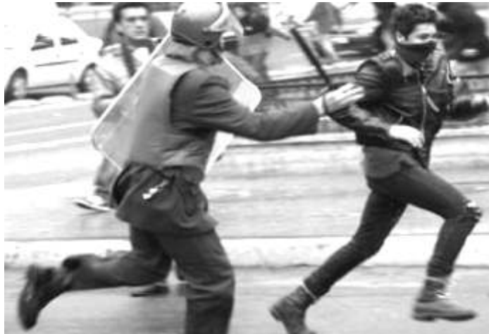
Carabineros en campaña de inscripción electoral

Entendemos que desde inicios de la década, el PC y otras organizaciones políticas de la izquierda han batallado para que se reforme la Constitución, se elimine el sistema binominal y una serie de reformas que tenderían a "democratizar la democracia". Sería burdo (o hasta mal intencionado) aseverar que la totalidad de estos sectores realmente ven a esta democracia como algo "mejorable", es decir, que realmente crean que al calor de estas reformas va existir una