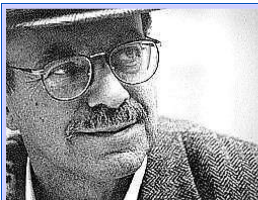
El sociólogo norteamericano, Prof. James Petras

“Es una lección que cuando las definiciones políticas están en serio hacia una transformación igualitaria, socialista, democrática no puedes contar con la intelectualidad, con la “whisky izquierda” como se llama” “Están por la revolución hasta el momento que ocurre la realidad” y “después inventan una excusa” para no estar”