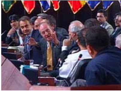
El minuto exacto de la frase que dio la vuelta al mundo.