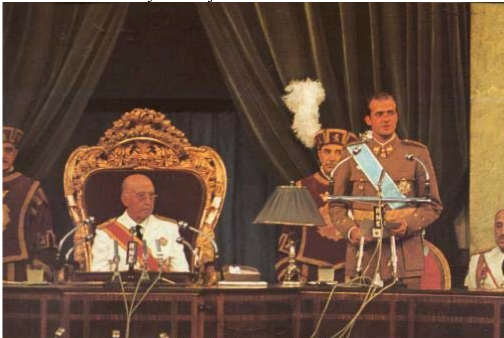
Franco y su recién proclamado sucesor, julio del 69

Don Juan Carlos de Borbón, aceptaba la sucesión de Franco en la Jefatura del Estado a título de rey. 23 de julio de 1969.