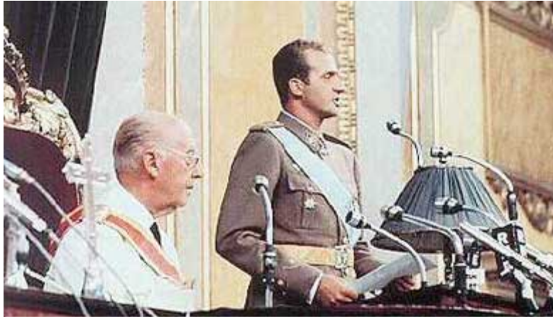
El dictador español Francisco Franco convierte en rey a Juan Carlos Borbón