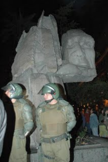
LA DETENCION AL MONUMENTO MAPUCHE