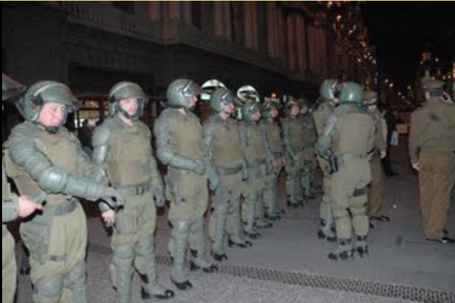
LOS CONVIDADOS DE PIEDRA