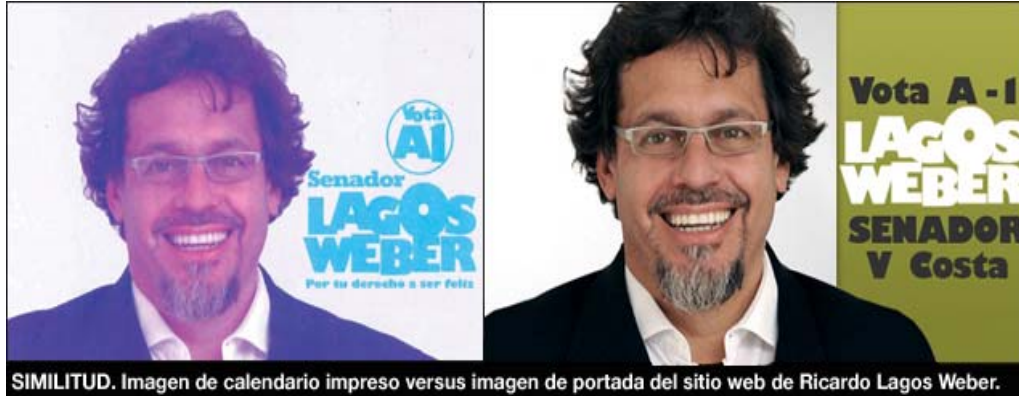
SIMILITUD. Imagen de calendario impreso versus imagen de portada del sitio web de Ricardo Lagos Weber. Estas

características o circunstancias especiales se aplican "cuando por la magnitud e importancia que implica la contratación se hace indispensable recurrir a un proveedor determinado en razón de la confianza y seguridad que se derivan de su experiencia comprobada en la provisión de los bienes o servicios requeridos, y siempre que se estime fundadamente que no existen otros proveedores que otorguen esa seguridad y confianza".