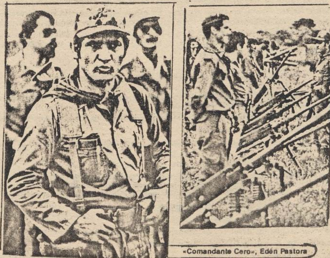
«Comandante Cero», Edén Pastora