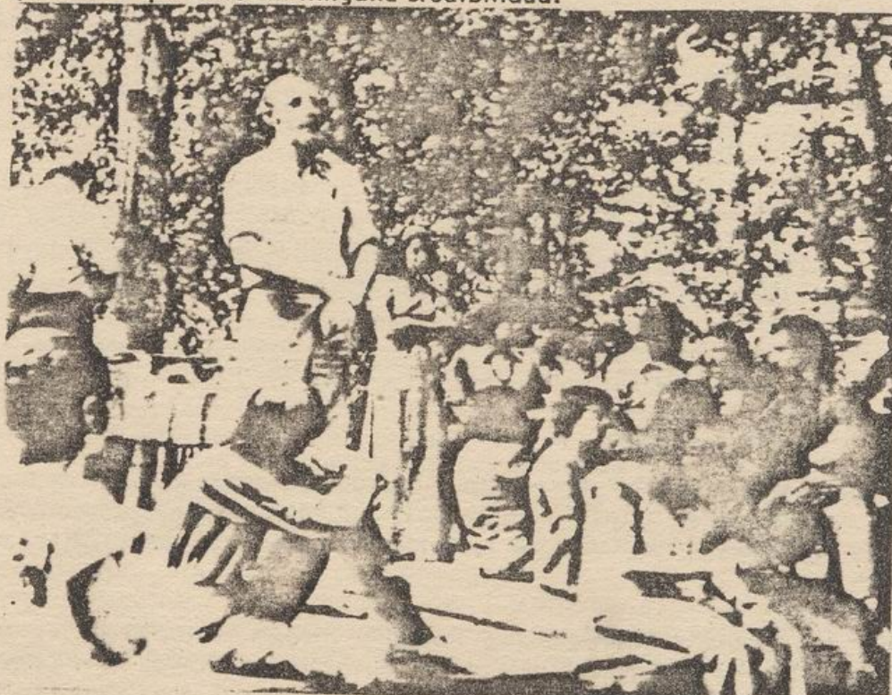
Ultima foto de Letelier vivo. 18 de Septiembre de 1976, junto a los exiliados chilenos en Washington

La Junta Militar chilena, que derrocó a un gobierno democrático, con este hecho, ha arrogantemente ridicularizado al Departamento de Justicia y al Departamento de Estado y también a un jurado de ciudadanos norteamericanos. Ha desafiado las bases fundamentales de la soberanía norteamericana en la propia capital de los Estados Unidos. Si los Estados Unidos no adopta fuertes medidas, no sólo los diplomáticos y exiliados que viven en este país, sino que también ciudadanos norteamericanos que son amigos o colegas, como Ronni Moffitt, estarán expuestos al terrorismo extranjero. Futuros asesinos no tendrán que preocuparse ya que los Estados Unidos no pedirá su extradición como consecuencia de sus actos. Y la Administración de los Derechos Humanos del Presidente Jimmy Carter tendrá que abandonar su pretendido liderazgo moral en esta materia, ya que habrá quedado sin ninguna credibilidad."