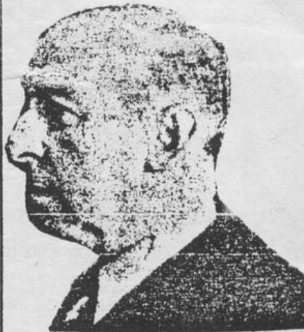
Marmaduke Grove, el segundo Secretario General del Partido Socialista desde 1939 a 1943.

muestran el esfuerzo, el tezón y el análisis correcto para avanzar en la concreción de sus postulados de clase, no por nada constituye quizás el único partido no comunista que se define como marxista ya por aquella década del 30, década de conflicto social emergente en el continente, de revolución socialista triunfante y de esperanza para miles y miles de explotados en la tierra, de una vida mejor.