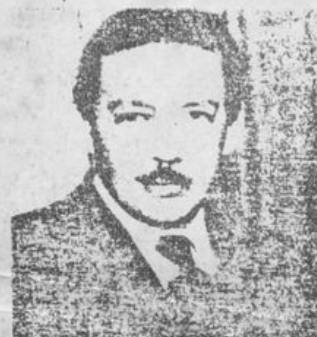
Oscar Schnake, el primer Secretario General del Partido Socialista desde 1933 a 1939.