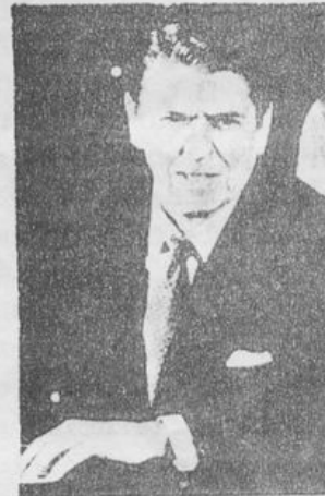
Reagan vuelve a la carga