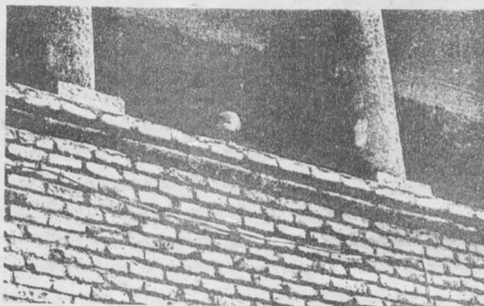
El régimen militar se va quedando cada vez más solo, cada vez más aislado