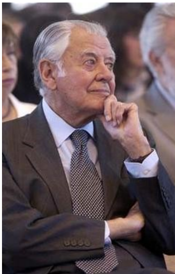
Ex Presidente Patricio Aylwin.

El ex Mandatario recibió a La Tercera Online para analizar los alcances del Congreso Ideológico de la DC, las opciones presidenciales de su partido, la amenaza de Piñera y el machismo de los políticos chilenos. "Yo soy antimachista", declara.