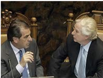
Los senadores Eduardo Frei y Adolfo Zaldívar acordaron que hoy se van a reunir para intercambiar puntos de vista en torno a la crisis de la colectividad.

El ex Mandatario postuló que la situación de crisis de su partido se debe a una larga y extenuante batalla entre dos grupos internos e insistió durante varios momentos en que de persistir la competencia, el partido se derrumbará. Su posición fue aplaudida por el sector zaldívarista y el alvearismo la criticó.