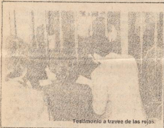
Testimonio a través de las rejas.

Unión de Estudiantes Democráticos (UNED), exigen la disolución de organismos de seguridad al interior de las universidades, la derogación de todas las órdenes de detención que pesan sobre estudiantes, la creación de una nueva Ley General de Universidades que sea plebicitada por toda la comunidad universitaria y la formación de una comisión de alto nivel que elabore un estatuto de garantías sobre los derechos del estudiantado.