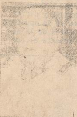
GENERAL Humberto Gordon.

♦♦ JUNTO CON someter al pueblo a la más cruel opresión, la dictadura no pierde oportunidad de tratar de engatuzar a sectores de oposición agitando el cascabel del "a perturismo". Así ocurrió de nuevo en vísperas del pasado Primero de Mayo. El dirigente de la Coordinadora Nacional Sindical, (CNS) Manuel Bustos, fue invitado por un personero del freísmo democristiano a una "muy reservada" reunión con un alto representante de la dictadura. Debe haber sido grande la sorpresa de Bustos al encontrarse con que su misterioso interlocutor era nada menos que el jefe de la DINA-CNI GENERAL Humberto Gordon Rubio. El actual jefe del asesinato y la tortura institucionalizados quería, nada menos, que proponer a la CNS el reconocimiento oficial del régimen a cambio de que la CNS se comprometiera, a su vez, a respetar las "reglas del juego" de ilegítima Constitución. Para materializar este "pacto de caballeros", el Esbirro N. 1 de Chile llevaba a Bustos una invitación para que la CNS participara en el acto oficialista del Primero de Mayo en el Edificio Diego Portales. La invitación incluía el derecho a tribuna mediante un discurso que pronunciaría el propio Bustos, previa lectura y aprobación del jefe de la DINA-CNI, y la promesa de que en su discurso Pinochet acogería algunas de las peticiones que formulara la CNS, siempre que éstas no se salieran del marco de la política laboral vigente. El apoplético jefe de la DINA-