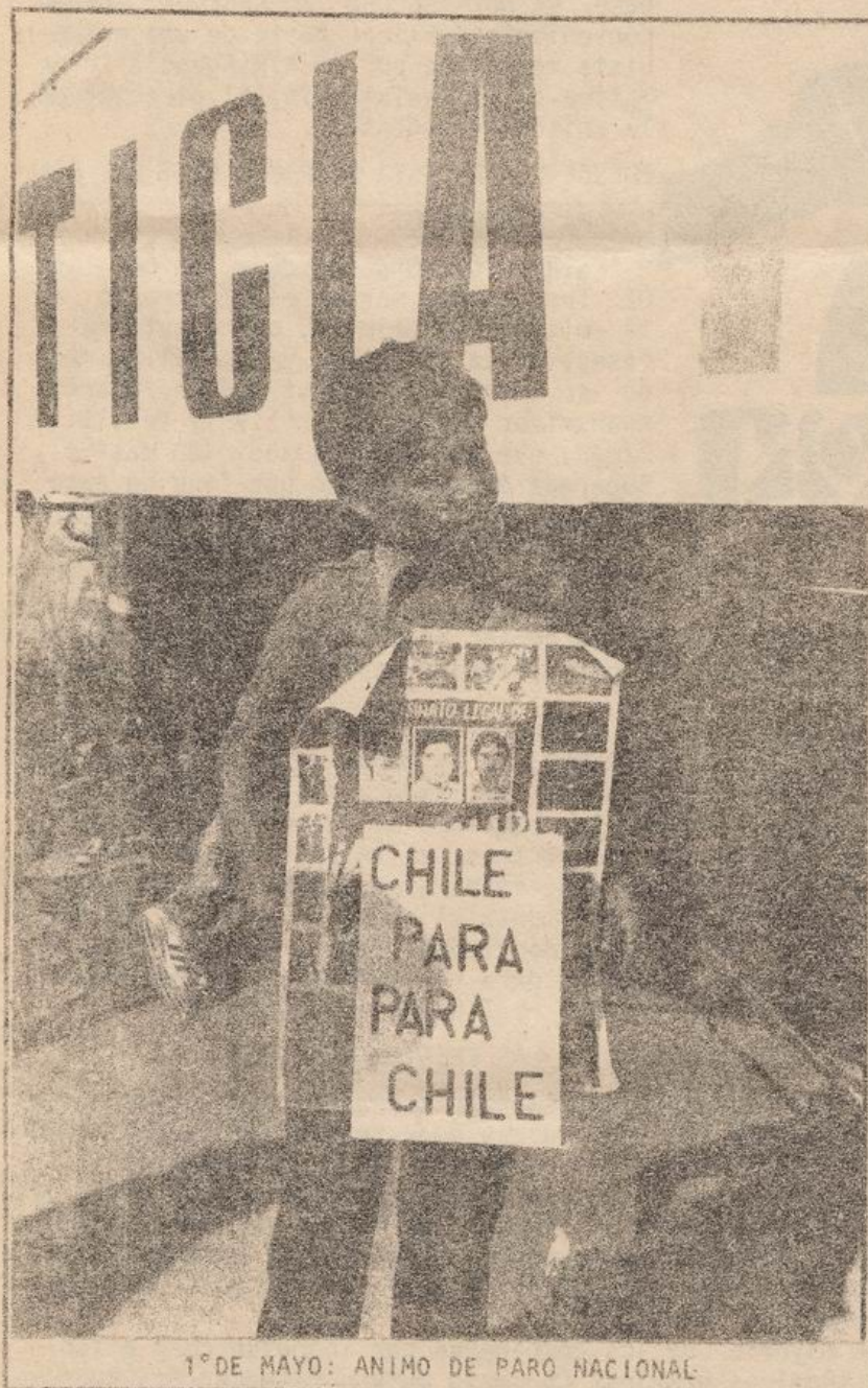
1° DE MAYO: ANIMO DE PARO NACIONAL

Las calles. Un grupo numeroso de alumnos del Liceo de Aplicación, del Instituto Nacional y del Colegio Salesianos se congregó el 10 de mayo en la Alameda con Cummings, donde quemaron neumáticos y enfrentaron a pedradas a carabineros y a un furgón policial que llegaron a dispersarlos. En su manifestación, los jóvenes llamaban a participar en la protesta nacional del 11 de mayo. Efectivamente, los estudiantes secundarios tuvieron una importante participación en la protesta, destacándose su actividad en provincias donde realizaron actos, concentraciones y marchas callejeras que, en muchos casos, concluyeron en instalación de barricadas para cortar el tráfico y en enfrentamientos decididos contra las fuerzas policiales y represivas. Los estudiantes piden reformulación de los planes de estudio y una mayor participación en los liceos y colegios.