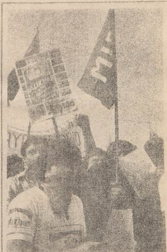
1° DE MAYO EN EL PARQUE O'HIGGINS

Al mismo tiempo, el pueblo ha denunciado de diversas formas la tergiversación que hace la