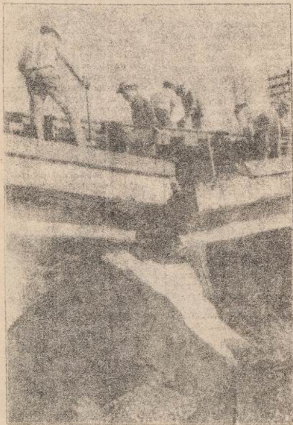
PUENTE LA ARAUCANA: SABOTAJE A LA VIA FERREA

Los pobladores sin casa protagonizaron 2 ocupaciones de terrenos consecutivas los días 8 y 9 de mayo. En la primera de ellas, en la comuna de La Florida, participaron 60 familias allegadas de los campamentos "Renacimiento" y "La Búsqueda". Cuando comenzaban a levantar sus carpas en terrenos ubicados en Walker Martínez con La Florida, los pobladores fueron de