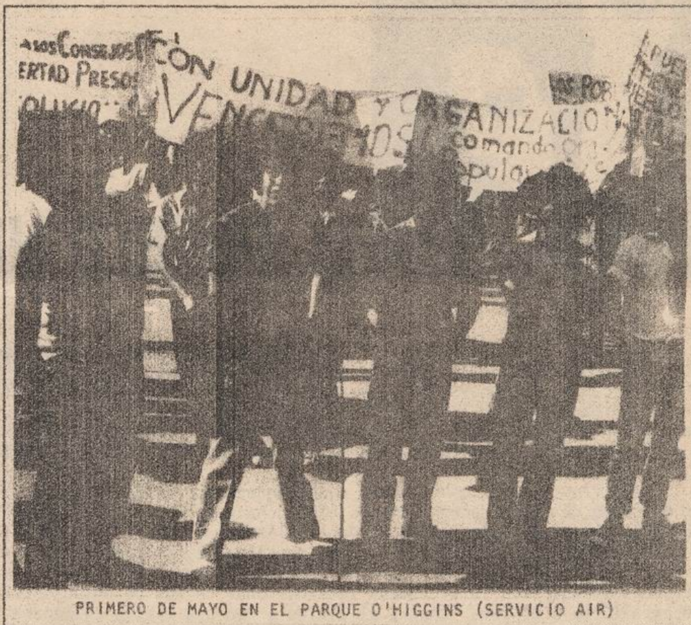
PRIMERO DE MAYO EN EL PARQUE O'HIGGINS (SERVICIO AIR)

La concertación social y política democrática, ya en una "mesa" -como lo propone el CNT-, ya en un "Acuerdo Democrático Nacional" -como lo ha propuesto el MDP-, tiene por lo tanto referencias claras en torno a las cuales estructurarse. En primer lugar, el compromiso con los objetivos programáticos irrenunciables: derrocamiento de la dictadura; instauración de un gobierno democrático, popular y revolucionario; Asamblea Constituyente; democratización de las FFAA; expropiación de los grandes grupos monopólicos; etc. En segundo lugar, el compromiso de no renunciar sino, por el contrario, el de seguir impulsando con fuerza y continuidad ascendente la movilización antidictatorial hasta la conquista de los objetivos democráticos del pueblo; sin transacciones de ninguna especie con el régimen o sus intermediarios.