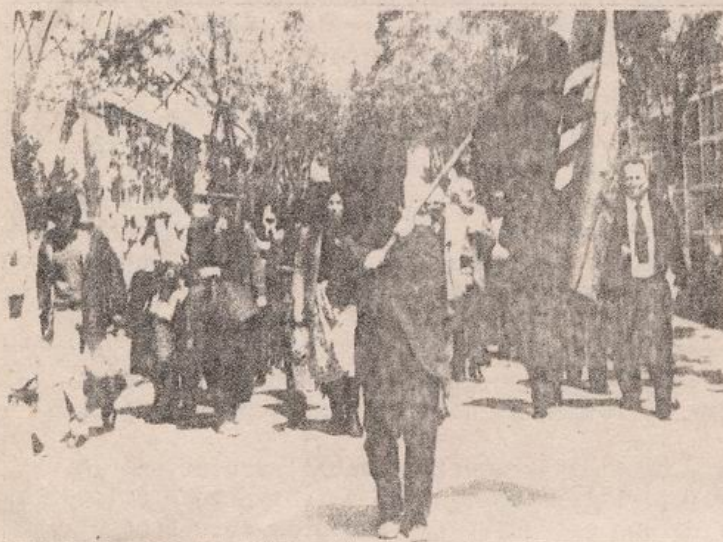
DESFILE EN EL CEMENTERIO GENERAL

Esa misma tarde, pobladores de La Bandera marcharon hasta la casa de Santa Fe, en San Miguel, donde cayó luchando el dirigente del MIR. Otros actos de homenaje se realizaron en distintas poblaciones y ciudades del país. En tanto, varios sectores de Santiago se estremecieron la noche del 4 de Octubre con apagones, sabotajes y bombazos milicianos.