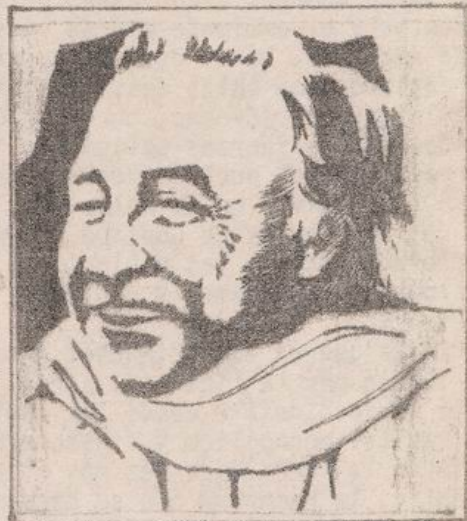
LUIS CORVALAN LEPE SECRETARIO GENERAL DEL PC

Partido Comunista de Chile Comisión Política