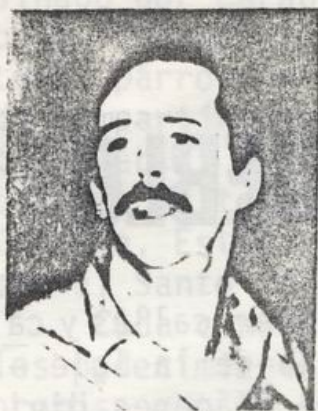
EL MIR, EN LA SENDA DE MIGUEL

bierno democrático, popular y revolucionario. Durante estos trece años nuestro Partido ha cometido errores y ha sufrido reveses. Pero no ha caído ni caerá en el desaliento. Los errores los ha corregido y las derrotas parciales las ha superado.