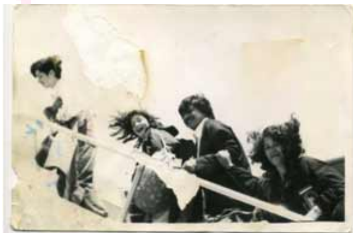
Otra vez al exilio. Ahora se

Un grupo pequeño de huelguistas, un grupo de apoyo grande. Antes que este movimiento comenzara, la organización de presos políticos había quedado sin iniciativa, el ambiente dentro de la cárcel era muy triste, a pesar que la cárcel se habría cada día más y más hacia adentro, pero nunca hacia afuera.