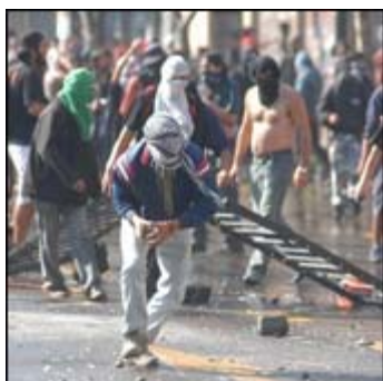
Imagen de archivo de las manifestaciones de estudiantes de la semana pasada

Con más de mil detenidos culminaron las protestas protagonizadas por los estudiantes secundarios en distintas ciudades del país, en una jornada que estuvo plagada de hechos violentos, con daños a la propiedad privada y pública e incluso cuatro carabineros heridos en Santiago.