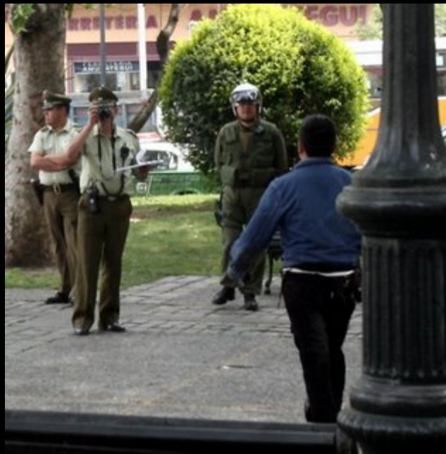
Dos artistas callejeros protestaron en la Alameda con Lord Cochrane subiéndose a una señalética, para ser escuchados y así recuperar su derecho a ganarse la