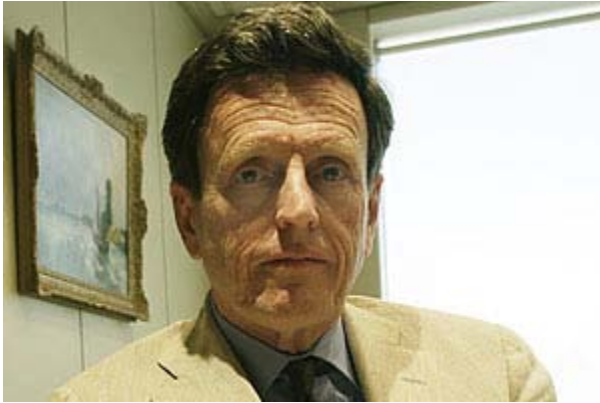
Larraín aseguró que "llevar un buen candidato no es ninguna ofensa".