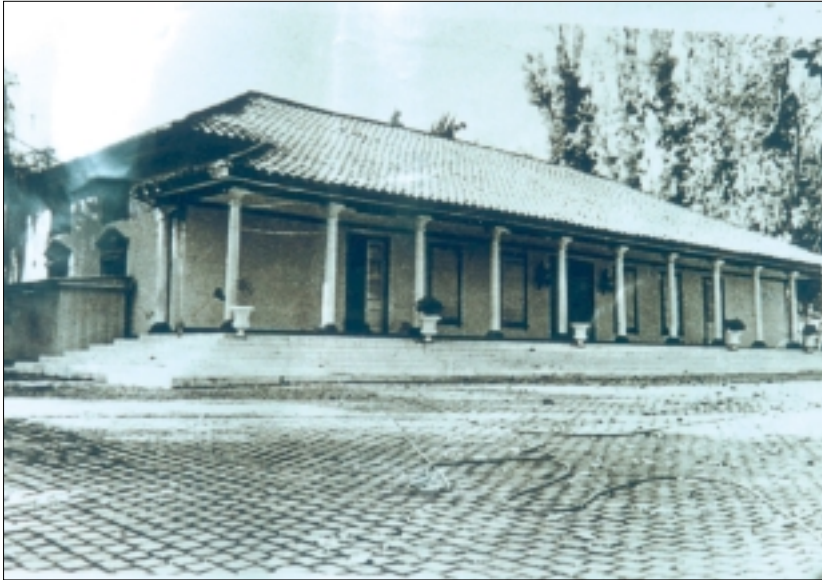
Villa Grimaldi, Región Metropolitana