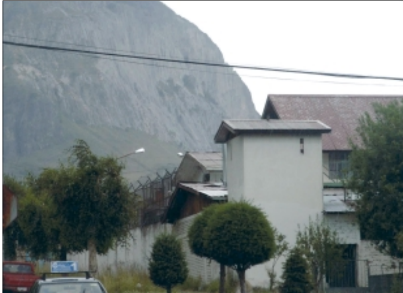
Cárcel de Coihaique, XI Región