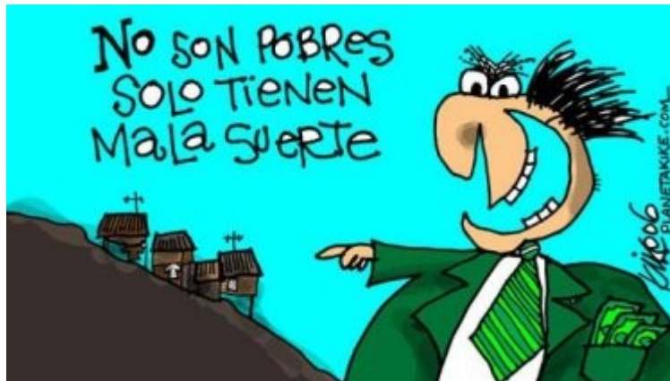
Los necios no son sólo ellos www.rebelión.org

Crítica postcolonial, postoccidental y postracional, en www.guardaelguachazo.com.ar