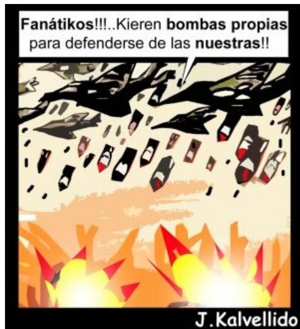
El lobo feroz norteamericano www.rebelión.org