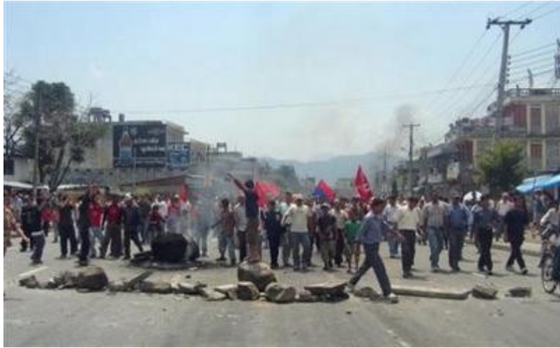
Huelga General en Nepal, Asia