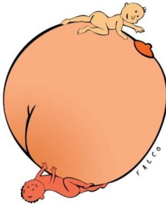
Alex Falco Chang - Mundo desigual- rebelión -8/4