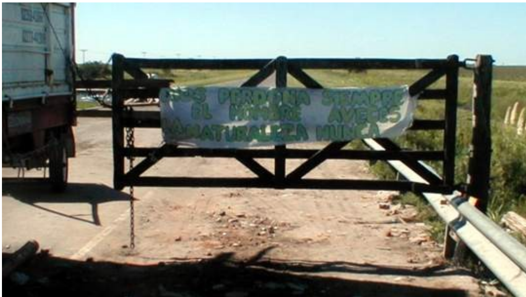
Dios perdona siempre. El hombre a veces. La naturaleza nunca Gualeguaychú- www.guardaelguachazo.com.ar