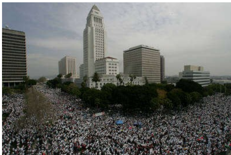
Movilización de los latinos en EE.UU