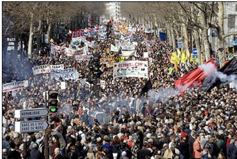
Huelga General y movilización en Francia