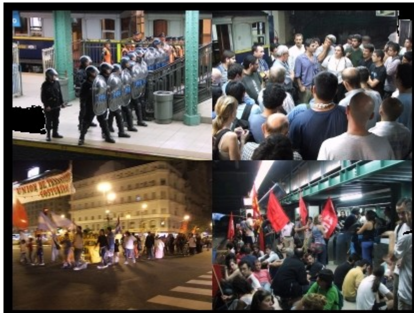
La lucha en el subte - Anred