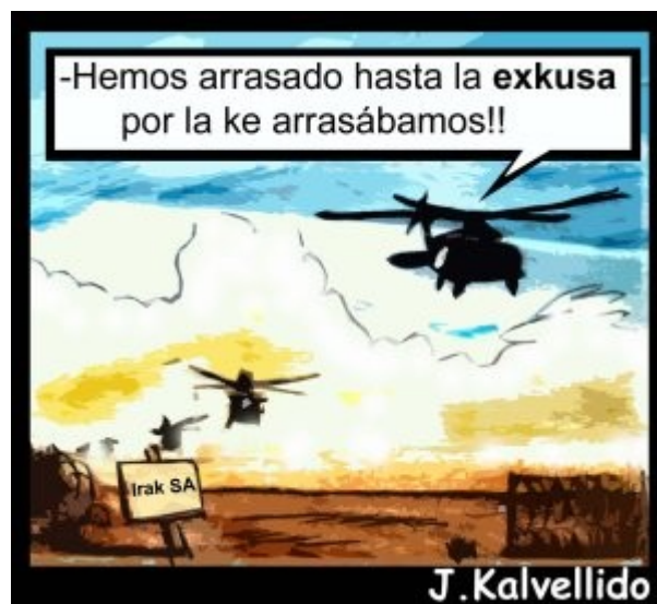
La guerra real y la política de EE.UU Rebelión